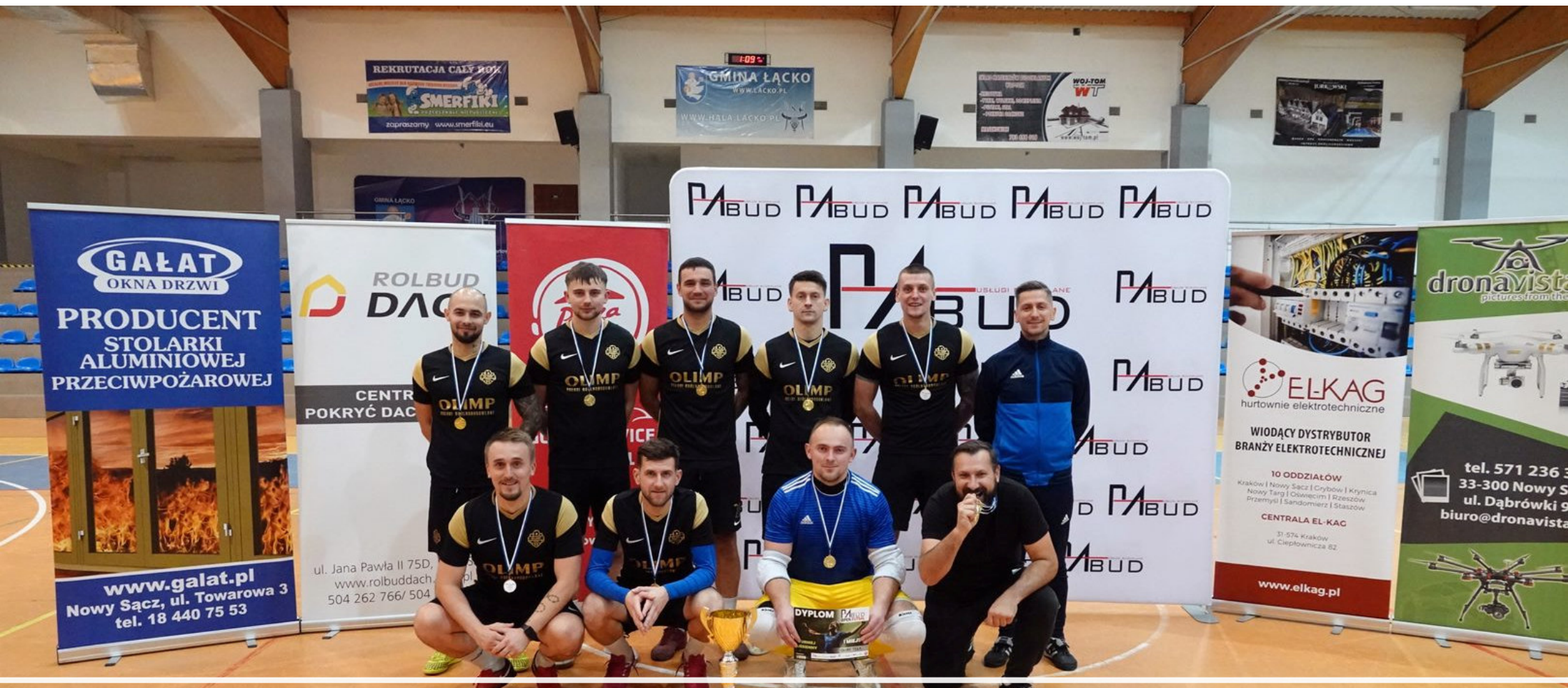
Turniej halowy PABUD OPEN FUTSAL organizowany przez ŁF Sport Events.